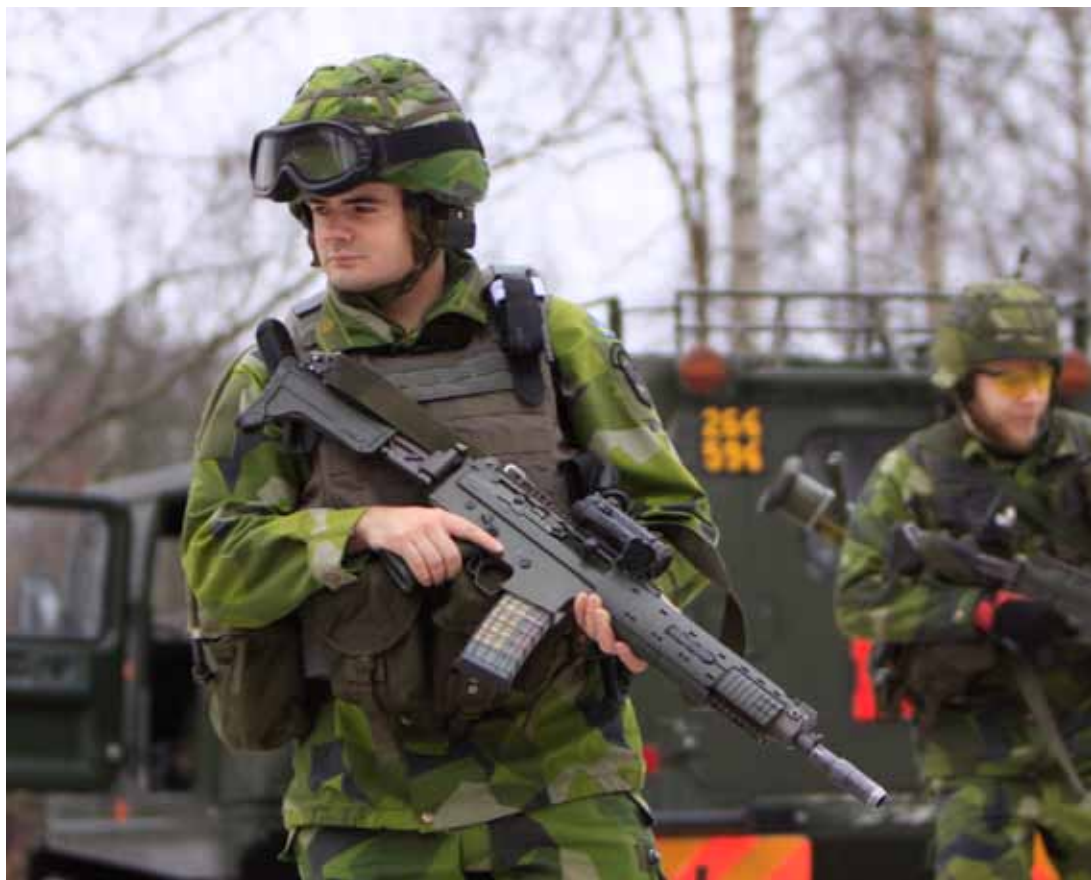
Att upprätthålla och repetera soldatfärdigheterna är en viktig del av tjänsten.