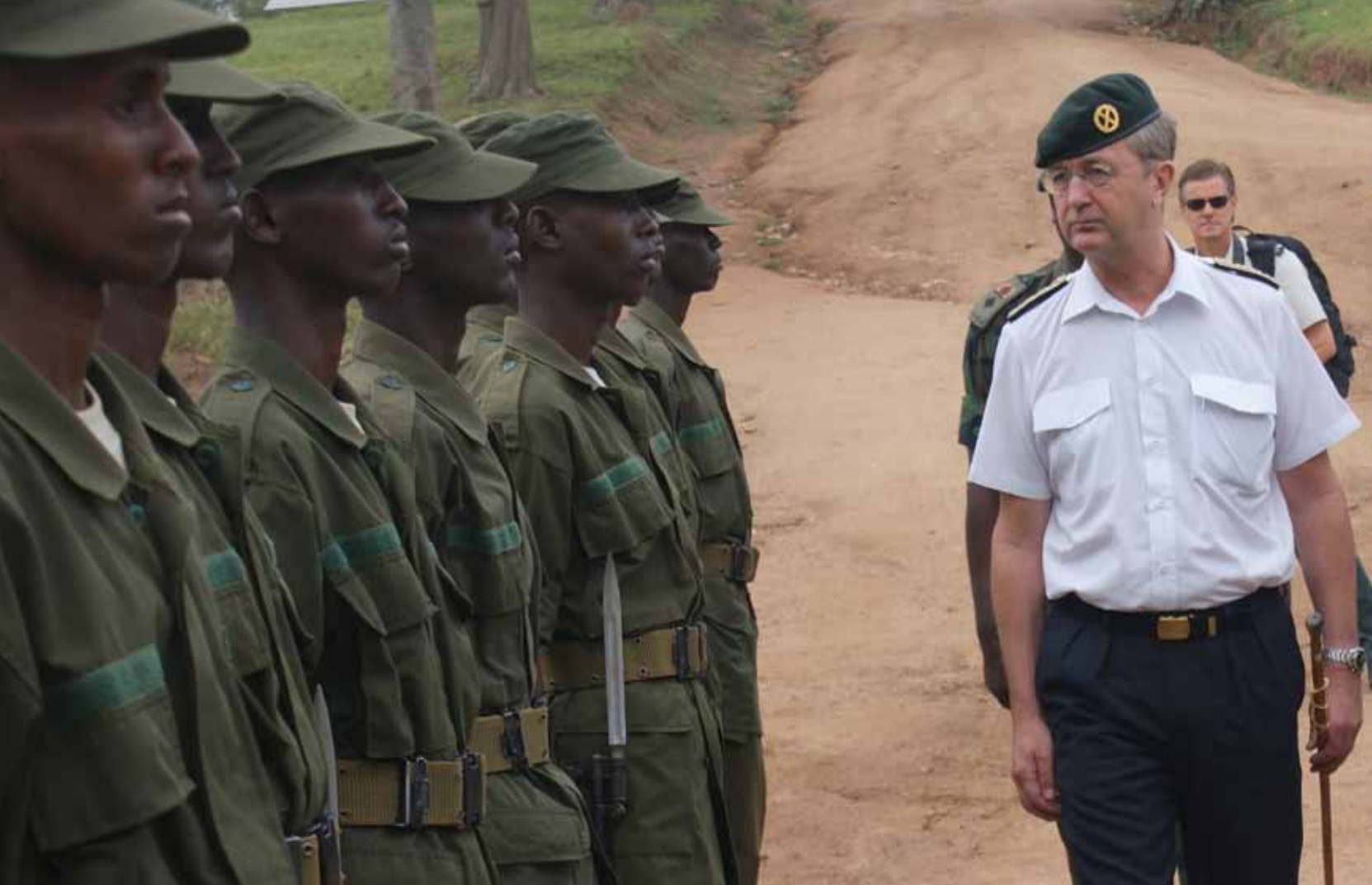
Inspektion i Afrika ...