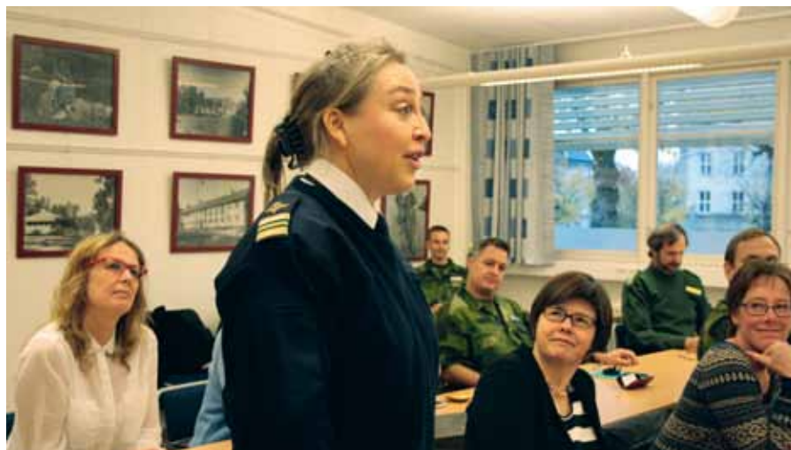
Intresset var stort när införandegruppen introducerade emilia för nyckelpersoner på förbanden. Nu måste förberedelser göras inför uppbyggnaden.

– Endast medlemmarna kommer kunna skriva i samarbetsytan, men alla kan läsa. Alla som vill, kan följa vad som