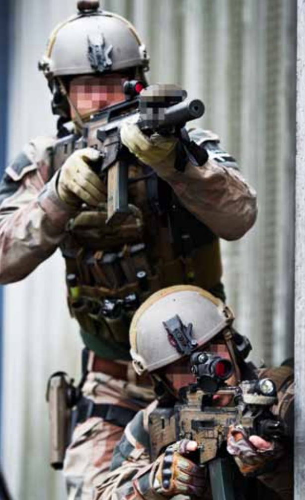
Personal ur Särskilda operationsgruppen skyddas av sekretess.

S ärskilda operationsgruppen, SOG, är en enhet som präglas av diskretion och både operationer och personal är skyddade av sekretess. Många uppgifter om vad förbandet klarar av, hur de arbetar och vilken utrustning de har, måste vara hemliga för att de ska kunna lösa sina uppgifter på ett effektivt och säkert sätt. Förbandet bildades 2011 genom sammanslagningen de två tidigare specialförbanden Särskilda skyddsgruppen och Särskilda inhämtningsgruppen.