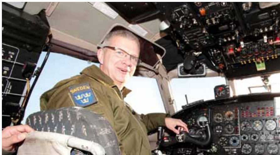
Kontroll av navigationsinstrument vid "pre-flight-inspection".

Med endast 72 timmars varsel landar ett ukrainskt An-30-flygplan på Uppsala flygplats måndagen den 22 oktober. Flygrutten är fortfarande okänd och lämnas senast 24 timmar innan. Information om tidpunkt och flygrutt för inspektionen