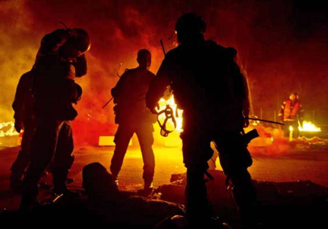
Gruppen får besked via radio att fienden är på väg tillbaka vilket innebär att de måste omgruppera.