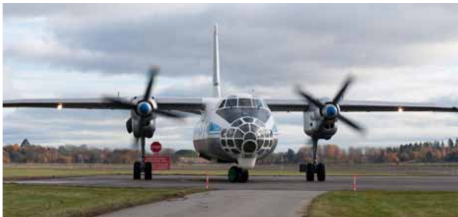
Ukrainsk AN-30 anländer till Uppsala Ärna.

Ukraina har för första gången genomfört en observationsflygning där teamet med hjälp av flygfotografering inspekterat svenska militära enheter och materiel. Verksamheten klassades som en klar fientlig handling under kalla kriget, i dag är den ett bevis på öppenhet mellan länderna.