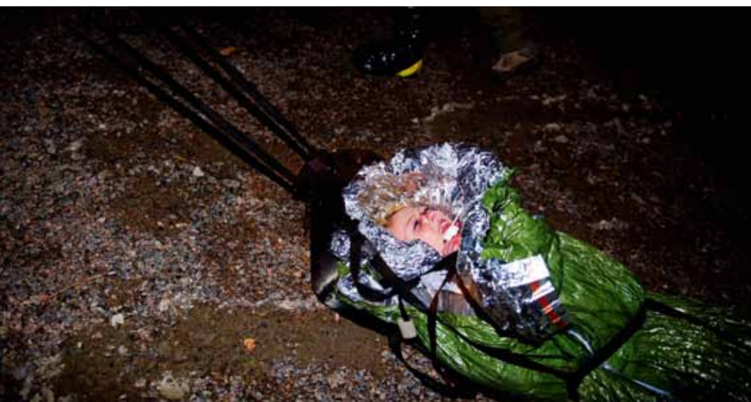
För att undvika att skadade hamnar i chock, hålls de varma med foliefiltar och värmeplattor.