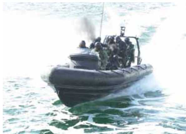
Sjötransportenheten är en del av systemet för stöd till specialoperationer.