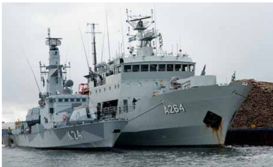
HMS Trossö och HMS Sundsvall förtöjda i Västervik. Det blev en kort visit denna gång, innan fartygen gick loss igen för att transportera sig till respektive hemmahamn.

Mellan den 16 och 26 oktober pågick Swenex 12-2 som är en stor nationell övning med deltagare från samtliga marina förband samt F 17 och Helikopterflottiljen. Från marinen deltog korvetter, stridsbåtar, minröjningsfartyg, ubåtar och stödfartyg i Östersjön. Den övergripande målsättningen var att öka förmågan att leda förband på flera nivåer och kunna hantera hot i luften, på och under ytan.