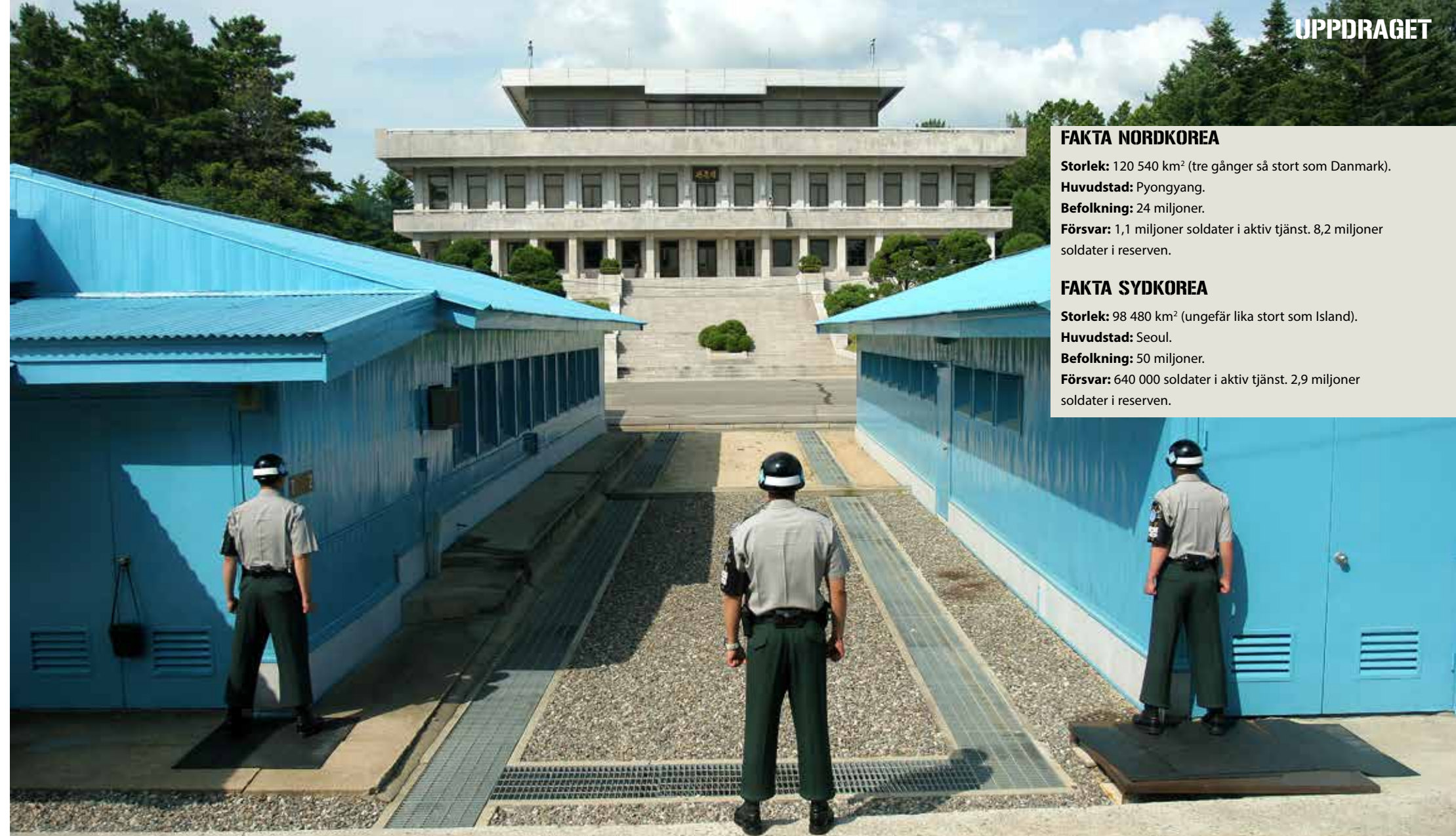
Gränsen vid DMZ. Den exakta gränslinjen utgörs av betongblocket mellan sanden och gruset, ständigt bevakad av soldater från båda sidor. De sydkoreanska soldaterna på bilden står till höften dolda, dels för att utgöra mindre måltavla men också för att kunna ge handsignaler bakåt.

I våras skickade Nordkorea skrämselficka genom världen genom att klippa alla kommunikations- och samarbetskana-ler med sin södra granne. Under augusti genomförde USA och Sydkorea en större militärövning, något som