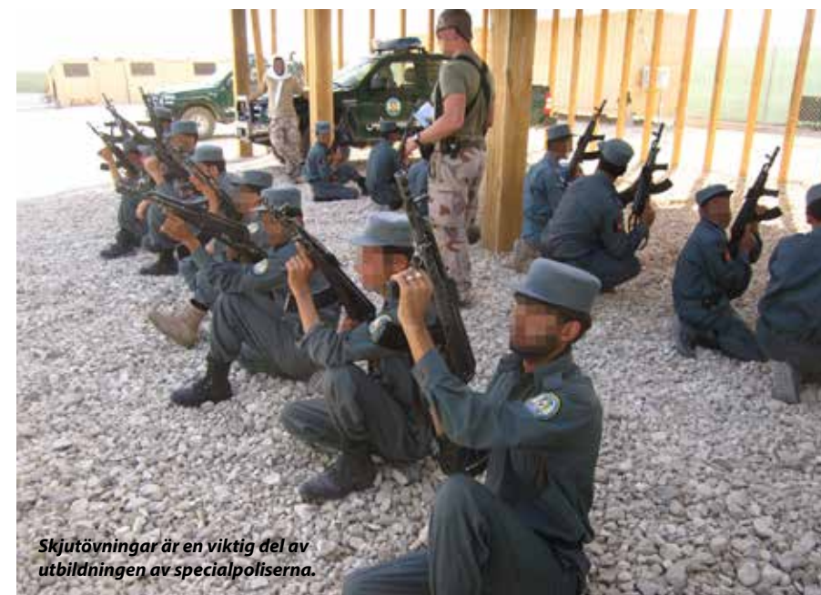
Skjutövningar är en viktig del av utbildningen av specialpoliserna.

Den afghanske åklagaren, som alltid följer med vid tillslag, diskuterar med polisbefälet och de jämför bilder på den efterlyste med mannen de träffat på i huset. Det är rätt person. Under tiden har den andra polispatrullen sökt igenom de övriga husen innanför muren och omhändertagit två personer. En