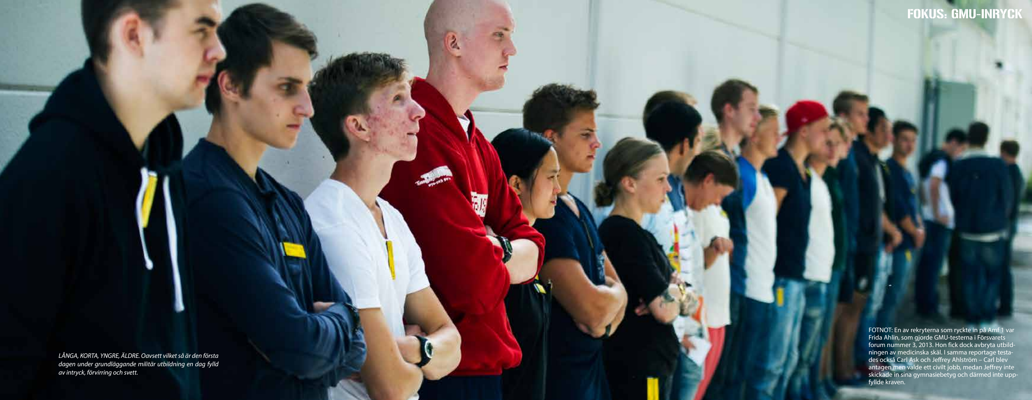
LÅNGA, KORTA, YNGRE, ÄLDRE. Oavsett vilket så är den första dagen under grundläggande militär utbildning en dag fylld av intryck, förvirring och svett.