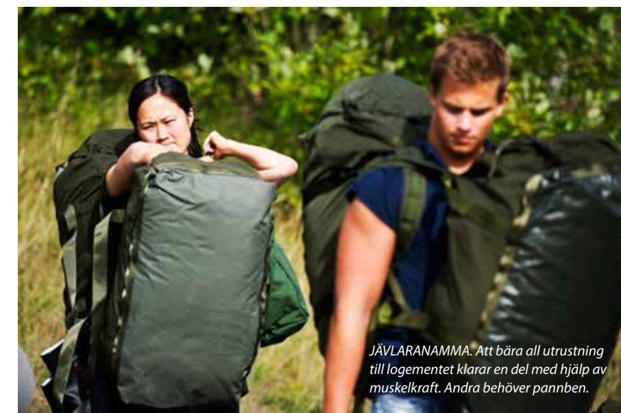
JÄVLARANAMMA. Att bära all utrustning till logementet klarar en del med hjälp av muskelkraft. Andra behöver pannben.

TEXT: DAG ENANDER/INFOS