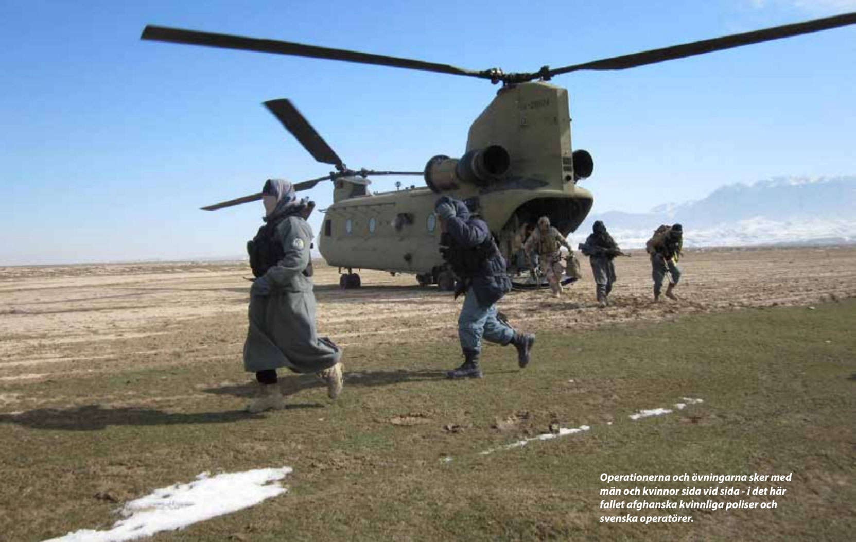
Operationerna och övningarna sker med män och kvinnor sida vid sida - i det här fallet afghanska kvinnliga poliser och svenska operatörer.

Specialförbanden har nyligen avslutat en tre år lång utbildningsinsats i Afghanistan som en del i en av specialförbandens huvuduppgifter, rådgivnings- och utbildningsstöd till internationella partners. Bakgrunden var att insatschefen 2009 insåg att säkerhetsläget i Afghanistan försämrats, vilket även drabbat det svenska ansvarsområdet. Därför beslutade han efter godkännande av regeringen att skicka en förstärkningsenhet ur specialförbanden dit.