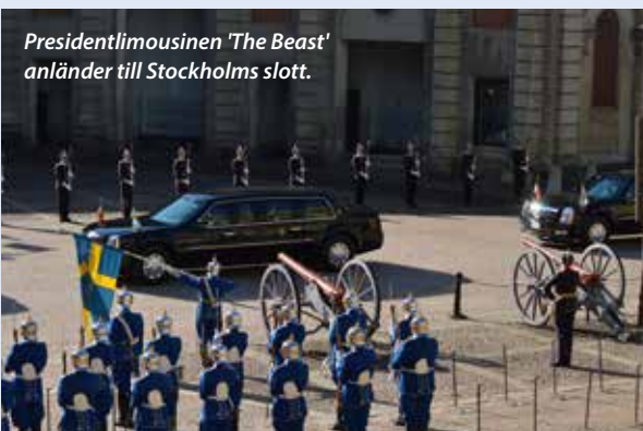
Presidentlimousinen 'The Beast' anländer till Stockholms slott.

– Det här är det största jag har varit med om under min tid på Livkompaniet och det var ett riktigt hedersuppdrag. Det är världens mäktigaste man och vi fick stå och välkomna honom när han kom till slottet. Särskilt kul är det ju för att vi är kungens förband och att det var vi som fick vara på plats.